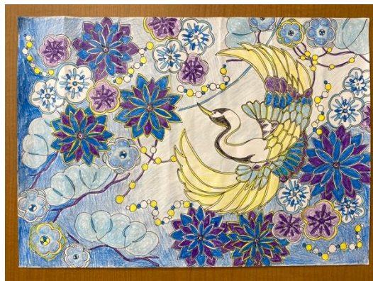
入賞したデザイン画

鹿児島ひっとべの会（本場大島紬織元有志の会）が主催する「第6回大島紬デザイン公募展」にデザインを応募し、鹿児島県かごしまPR課長賞に入賞した。