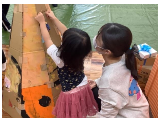
いろとあそぼう・かたちとあそぼう