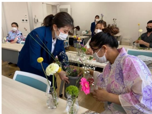
生け花の実習をアシスト

5月9日(日)・5月16日(日) かがしま国際交流センター 2年生4名 資料の英訳、通訳、実習補助等