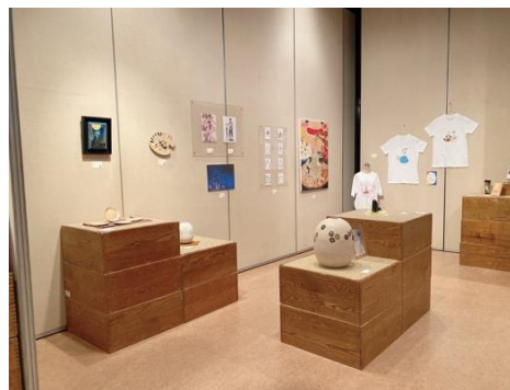
「卒業制作展 2022」会場の様子