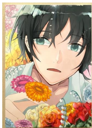
イラストレーション 「どの自分も愛して」