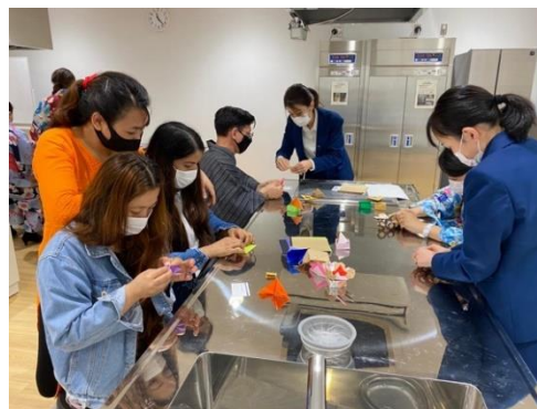
着付けの待ち時間に折り紙を紹介