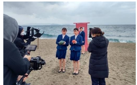
CM撮影の様子(神川海岸)

県内のAコープ(離島を含む)、山形屋ストア、城山ストア、錦江町の「にしきの里」、「ふる里館」、ストアークまさきで販売(数量限定にて発売)。