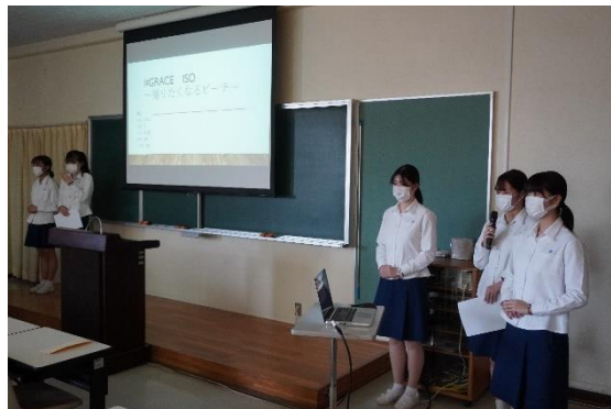
学生プレゼンテーション