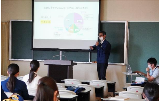
資源政策課の説明