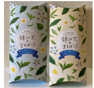
完成したパッケージ

まるぼうろをイベントのために錦江町の「菓心まとはら」様が特別に商品としたものである。学生アイデアをもとに作られたパッケージは、深蒸し茶(大根占茶：写真左)と浅蒸し茶(田代茶：写真右)で各100個ずつ限定販売した。茶葉の産地により色が異なり、一目でわかるデザインとなっている。