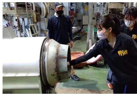
製茶工場での様子