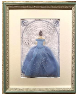
キルト「この日を待ちわびて」