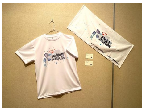
選ばれたTシャツ・タオルのデザイン