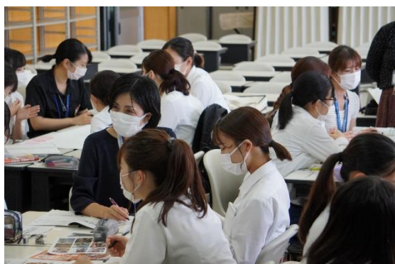
スポーツ課のワークショップ

前期「かごしま学Ⅰ」を受けて、郷土の課題に主体的に取り組む発展的な学び、課題解決型授業（Project Based Learning）を取り入れている。毎年、包括連携協定を結んでいる鹿児島市との連携による「まちづくり人材育成連携事業」を授業の中で実施。令和3年度のテーマは「磯ビーチ活性化」「コロナ禍における鹿児島マラソンのあり方」（スポーツ課）と「家庭ごみの減量化・資源化の方策」「市民向けの啓発活動のアイデア」（資源政策課）の2つの課よりいただいた。各課3コマの授業時間を使い（講義・グループワーク・プレゼンテーション）、与えられたテーマに対して学生たちはグループごとに思い思いのアイデアを出し合ってプレゼンテーションを行った。その後それに対する市役所の職員の方々から講評（フィードバック）をいただいた。