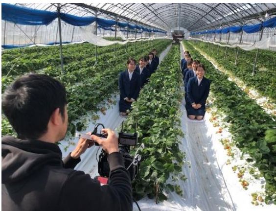
CM 撮影の様子（いちごハウス）