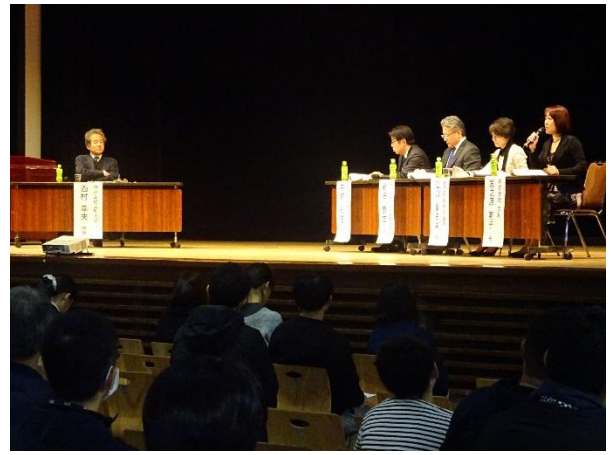
「第二次かごしま都市マスタープラン」シンポジウムの様子