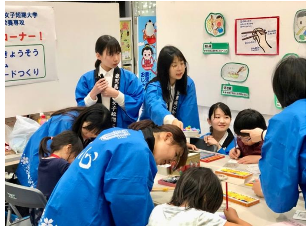
第5回かごしま食育フェスタ