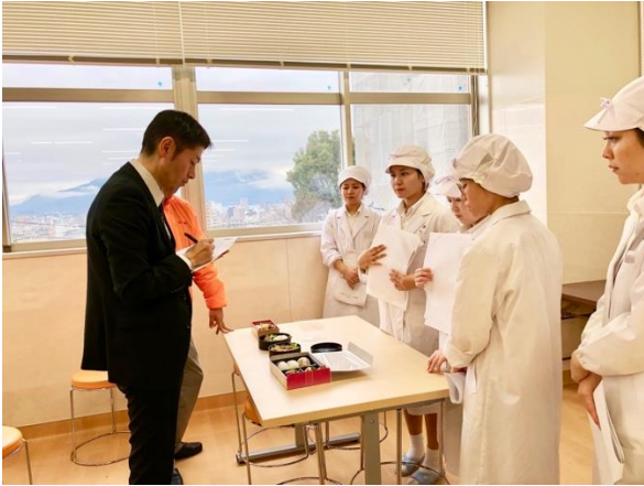
KK 松栄軒との試食プレゼン