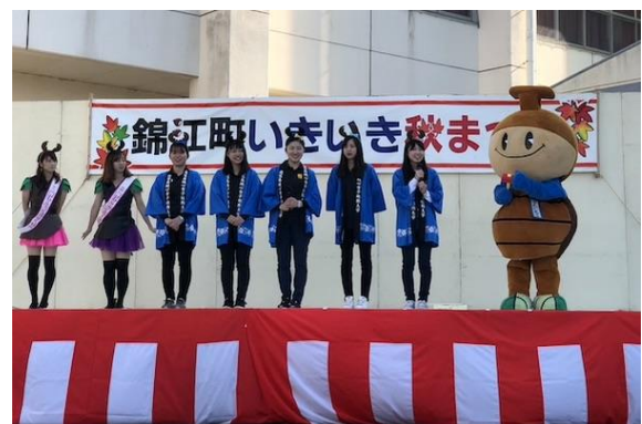
錦江町いきいき秋祭り