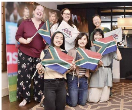
鹿児島市広報紙用写真撮影