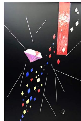
七宝・金属 「夢めぐりて」