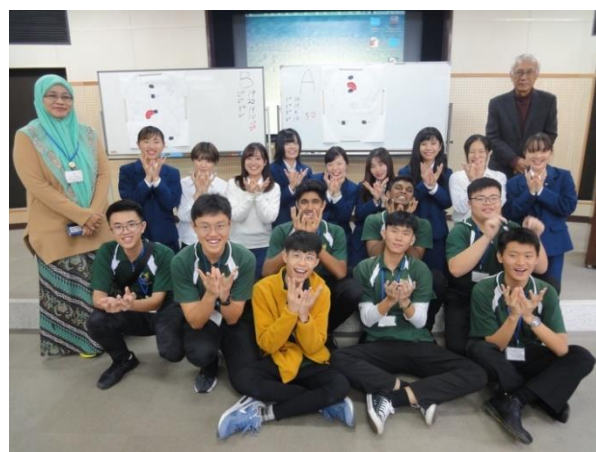
「パプリカ」の踊りで交流