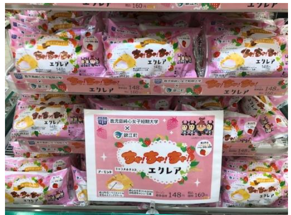
ローソン 鹿児島唐湊新川店の様子