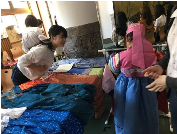
民族衣装コーナーの手伝い

4 月 21 日 (日) 中央公民館 2 年生 19 名 司会進行、受付、異文化体験ブースの補助、設営、菓子の買い出し等