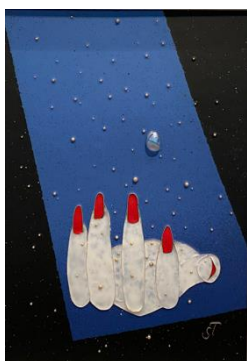
七宝・金属 「追憶」奨励

(令和元年 9 月 28 日～10 月 6 日 鹿児島県歴史資料センター黎明館)