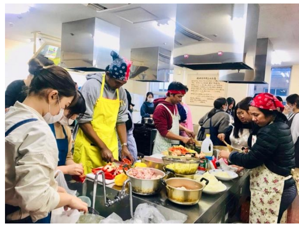
インターナショナルナイトでの調理の様子