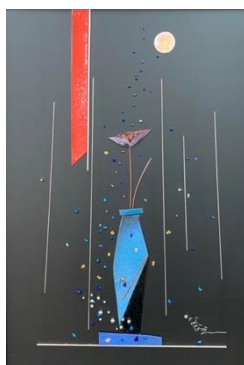
七宝・金属「月に映えて」