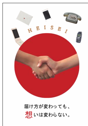
ビジュアルデザイン 「平成」