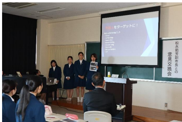
副市長との意見交換会の様子