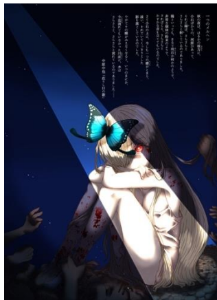
ビジュアルデザイン 「在りし日」 奨励賞

(令和元年5月18日～26日 鹿児島県歴史資料センター黎明館・鹿児島市立美術館)