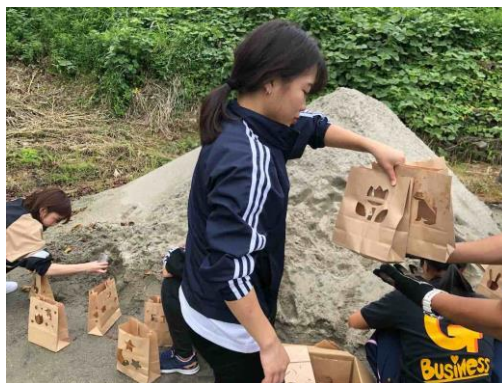
やまんなか音楽会