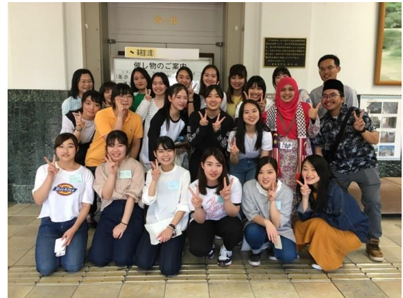
異文化体験ブースの方々との交流