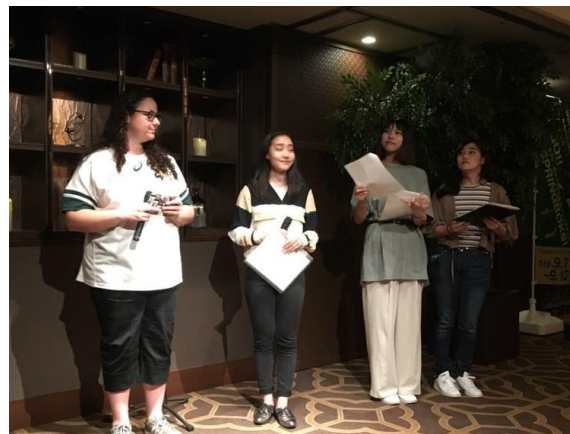
南アフリカ出身者の講話の通訳