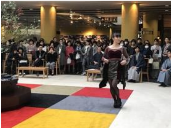
本場大島紬フェスティバル