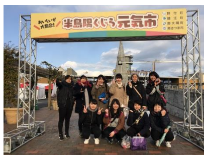
会場:ドルフィンポート