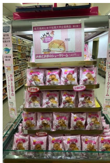
ローソン鹿児島唐湊新川店の店内