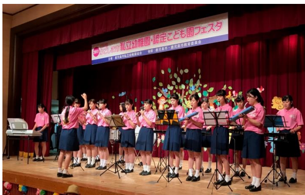
鹿児島市私立幼稚園

12/2 ファミリーコンサート(鹿児島市東部親子つどいの広場なかまっち)22名参加