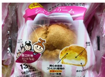
お米とお芋のシュークリーム