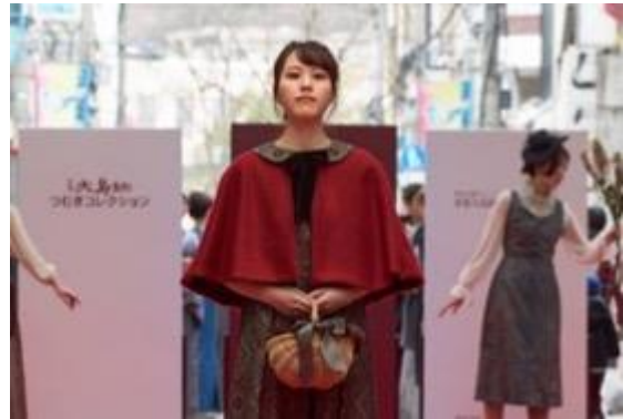
かごしまデザインフェア 2018 デザイン百覧会