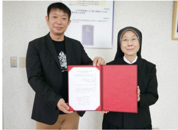
チェスト連合との協定調印式の様子