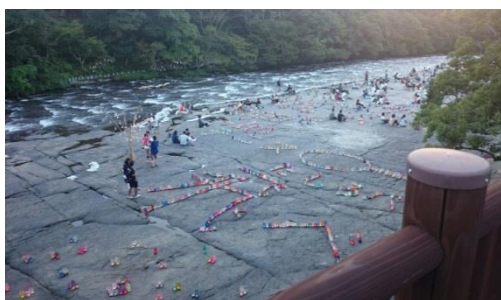
やまんなか音楽会