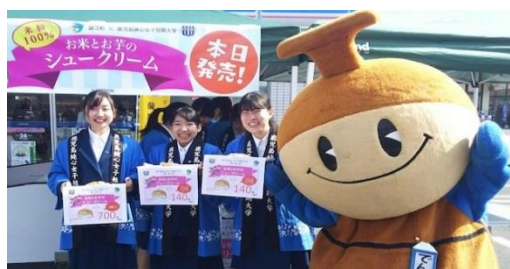
発売日のキャンペーン