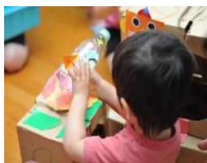
いろとあそぼう・かたちとあそぼう