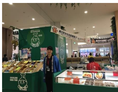
現代ビジネスコース 1年生