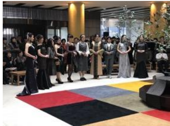
本場大島紬つむぎコレクション