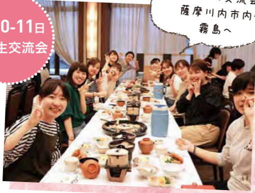
1泊2日の交流会 薩摩川内市内や 霧島へ