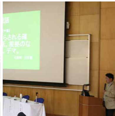
※写真は昨年度開催時のものです。