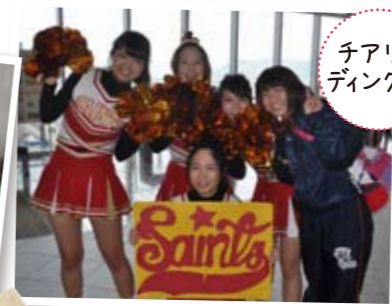
チアリーディング部