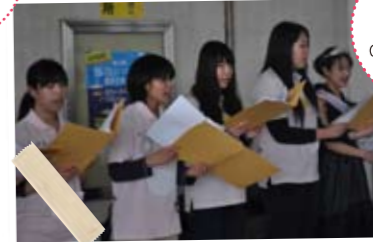
アカペラ (こども学科有志)