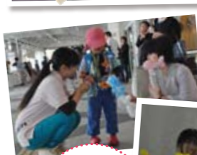
バルーンアート (こども学科有志)