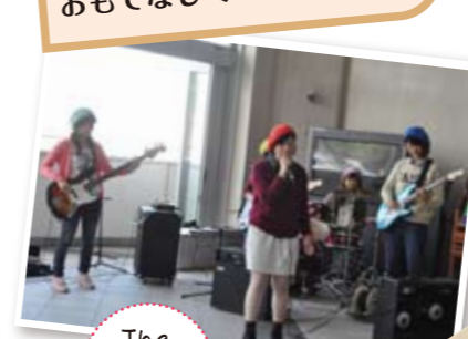
The Band Club